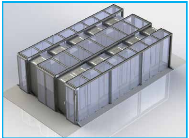
Confinamiento de pasillo frío y caliente